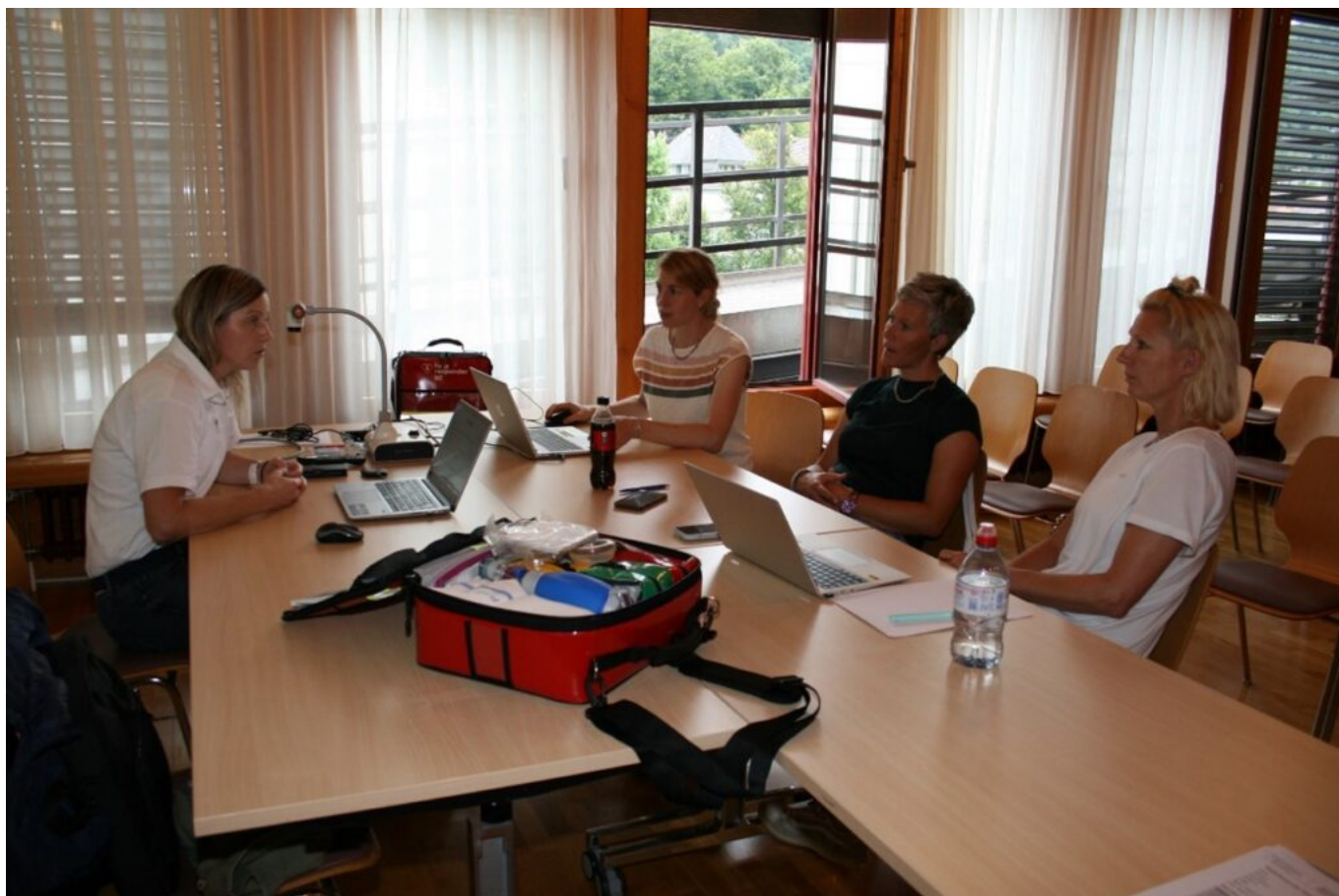
Grundschulung durch den Verein firstresponder.be mit den ersten drei RR-Hebammen